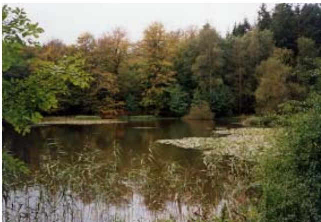
Elverdammen ved Søholt

Fra Holmsbakkevej går ruten mod nord ad en skovsti gennem en bevoksning af bøg. Øst for vejen ses et lille område, der allerede har været urørt i mange år. Det ses på de døde og døende træer med mange spættehuller og svampe. Om 100 år vil den nye naturskov, måske ligne dette lille skovstykke. Turen kan nu afsluttes ved enten at gå gennem den dyrkede skov til p-pladsen eller fortsætte tilbage til Elverdam.