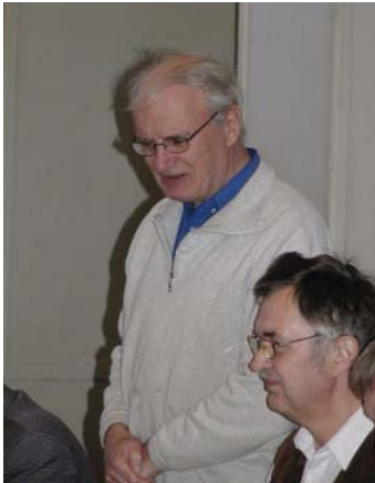
OZ5KM takkede for at være inviteret med igen i år