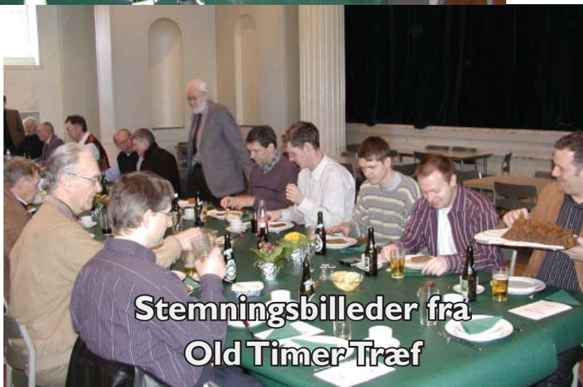
Stemningsbilleder fra Old Timer Træf