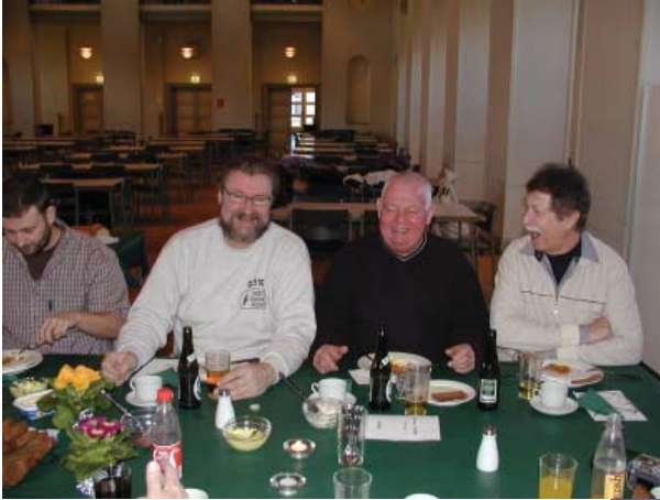
Glade deltagere til Old Timer Træf