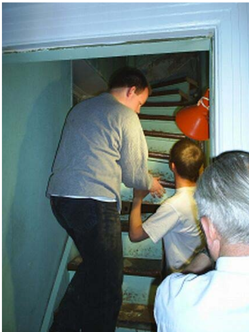
Den gamle trappe til scenen er ved at blive brudt ned.