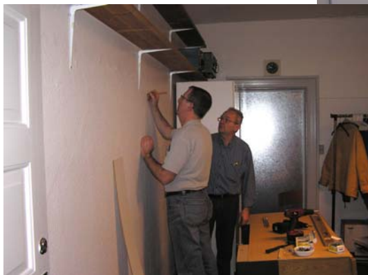
↓ Reolen sættes på plads.