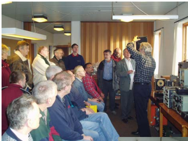
← OZ5WT Bent som auktionarius!