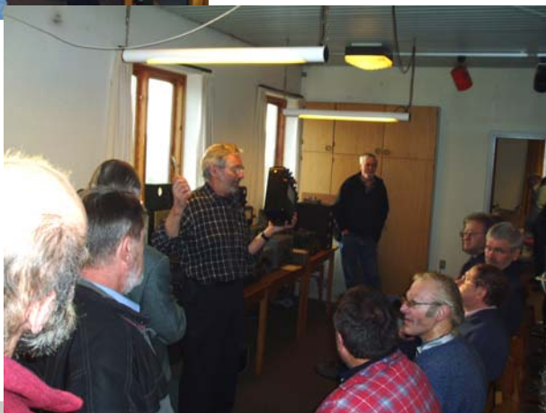
↓ OZ5WT Bent fortæller.