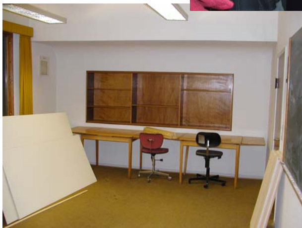
← Sådan så computerrummet ud efter auktionen: Alt ryddet!