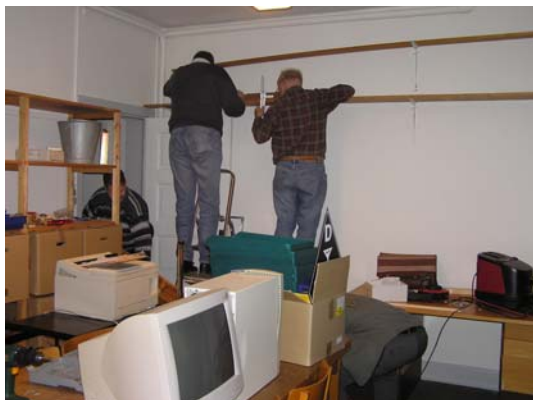
← OZ1GRL og OZ6JI i gang med at sætte hylder op.